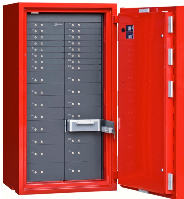
CWS 1600 avec compartiments bancaires